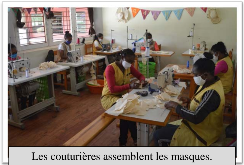
Les couturières assemblent les masques.

Peut-être que certains le savent, et que d'autres non, ou l'ont oublié : Para los Niños est membre du mouvement international d'aide à l'enfance (MIAE), Association qui fédère une vingtaine d'associations tournées vers le soutien aux enfants dans le besoin dans le monde. PLN entretient avec certaines de ces associations des relations plus étroites, avec lesquelles plusieurs projets ont vu le jour : c'est le cas notamment de « Esperanza, Joie des enfants » et de « la Lune à l'envers », même si cette dernière n'est pas membre du MIAE.