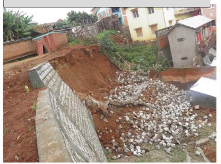
L'effondrement du mur de soutènement.