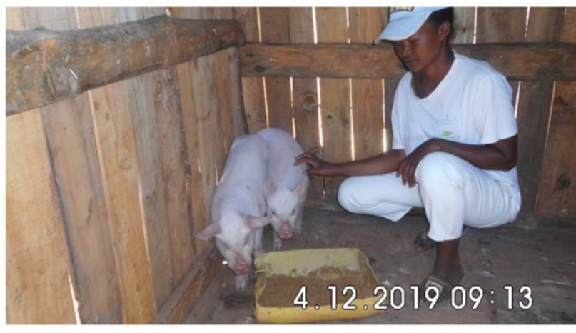
Une famille d'Ambohimena a démarré un élevage.

Les fonds alloués à ce projet sont donc conservés pour la rentrée scolaire d'octobre 2020 car le principe de cette opération est d'allouer un prêt aux parents scolarisant un enfant dans un de nos CN. Son remboursement pour une durée de 6 à 8 mois correspond peu ou prou à la durée de l'année scolaire.